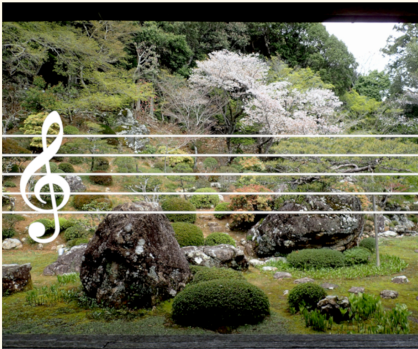
《竹林寺庭園を聴く》2026 (参考イメージ)

全国で、その地域と音楽自体をも再発見するような「街歩き+音楽」のワークショップ講師業を行なう。のこぎり三重奏「のこぎりバンド」でも活動中。